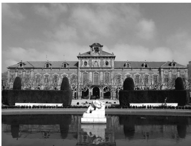
Parlament de Catalunya. Barcelona.

En l'àmbit social les enquestes intueixen un elevat índex de participació (entorn el 70%). Per una banda sembla que ningú vol perdre l'ocasió de contribuir en la creació